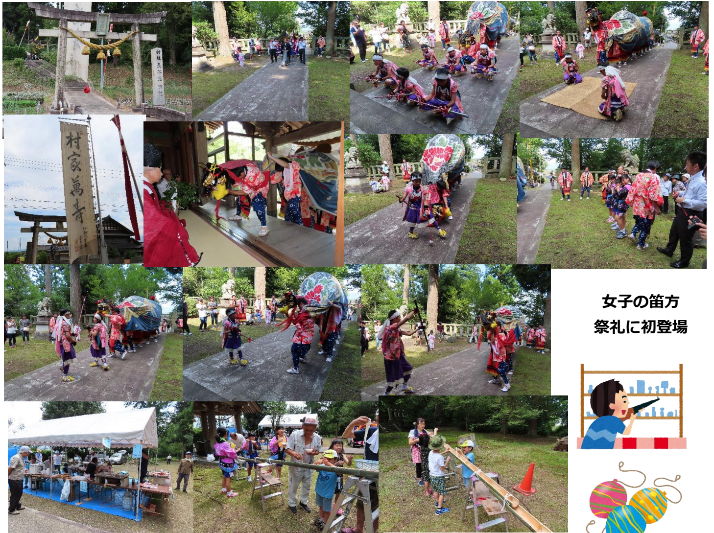
女子の笛方 祭礼に初登場

8月25日に安居の長谷玉神社で秋の祭礼がありました。 安居獅子方若連中（安居青年団）が獅子舞の練りまわしを行いました。