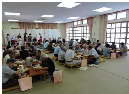
和みの会の手作りお祝い弁当で昼食