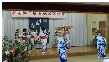
南砺市安居地区敬老会