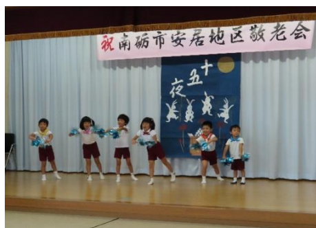
おひさま保育園安居地区園児