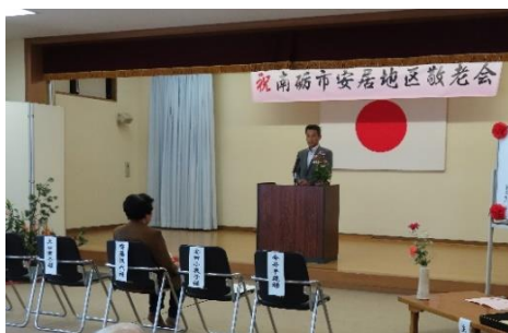
石川市議から祝辞