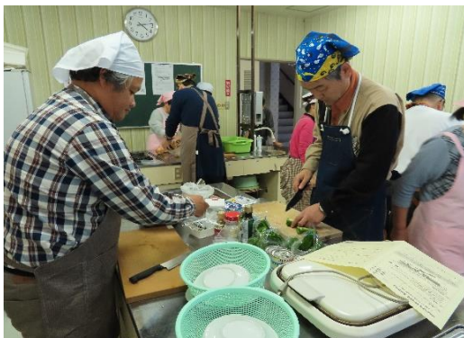
ピーマンを2つ割に

10月13日（日）に食生活改善推進員と男女共同参画推進員の共催で男の料理教室が開催されました