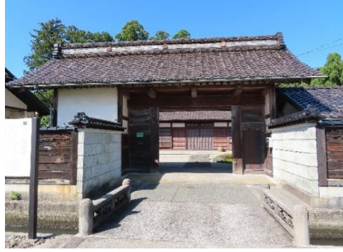
長屋門（薬医門という作りだそうです）