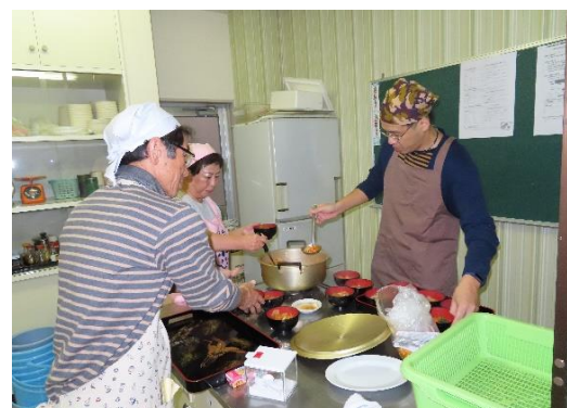
ラタトゥイユができました