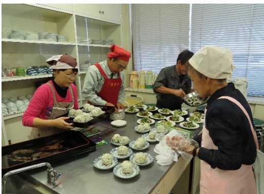
海藻サラダと雑穀ごはんのおにぎり

今回のメニューは 雑穀ごはんのおにぎり ピーマンのツナカレー詰め 海藻サラダ ラタトゥイユ の4品