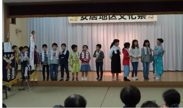
地区の小学生と婦人会が参加して夜高節を踊りました