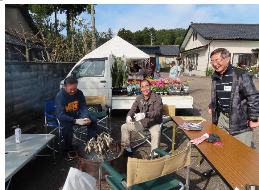
長寿会 は鮎焼 き