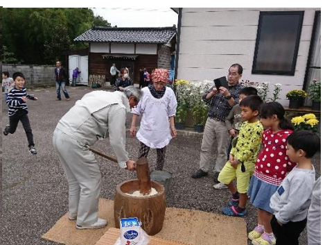
文化祭最後は恒例の餅つき