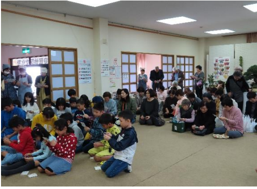
ビンゴゲームに真剣