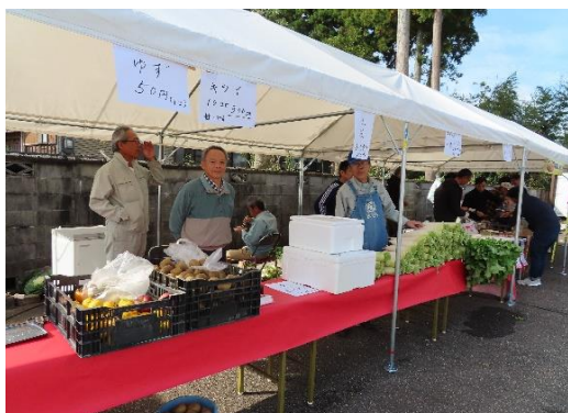
あんごの里の野菜販売