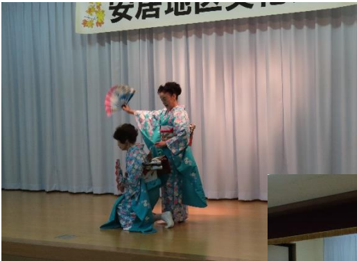
民踊 あべまきの会