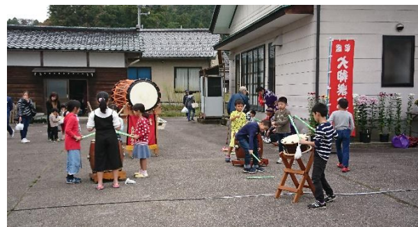
こどもたちも太鼓をたたきました