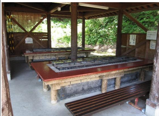
バーベキュー施設