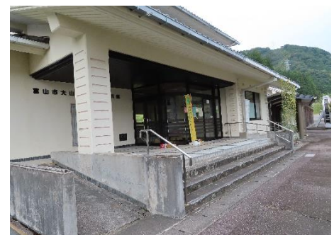
大山歴史民俗資料館

その後ビジターセンターに戻って「ふりかえり」を行い有峰森林文化村を後にしました。帰りに大山歴史民俗資料館を観覧しました。