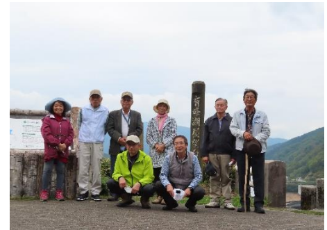
有峰湖展望台にて

有峰ビジターセンターで「はじまりの会」があり、その後有峰湖展望台で有峰ダムの説明を受けました。