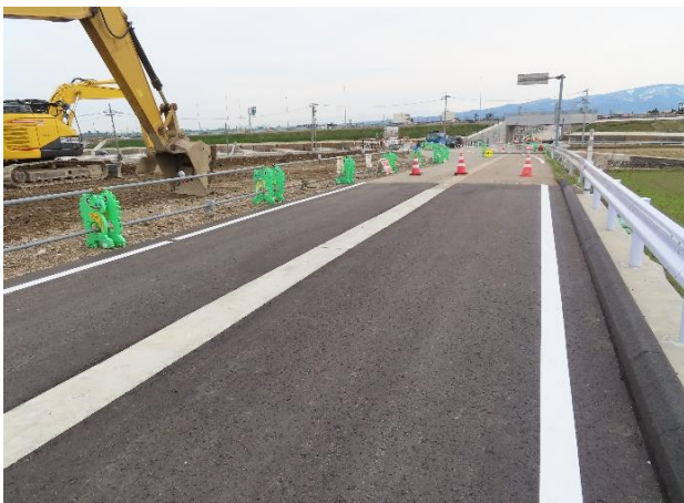
川崎橋から柴田屋方面

昨年の11月から川崎橋は橋詰での横断暗渠敷設工事に伴う車両通行止めになっていましたが、予定通り3月25日をもって解除される見込みです。