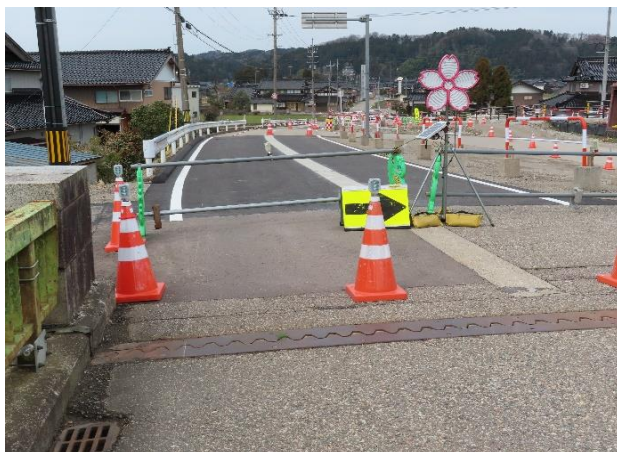
川崎橋から上川崎方面

地区内の交通規制はすべて解除されていると思いますが、スピードを出さないようにご注意ください。