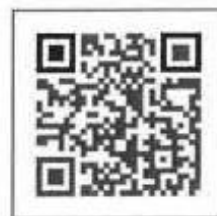
QRコードでインストール画面へ