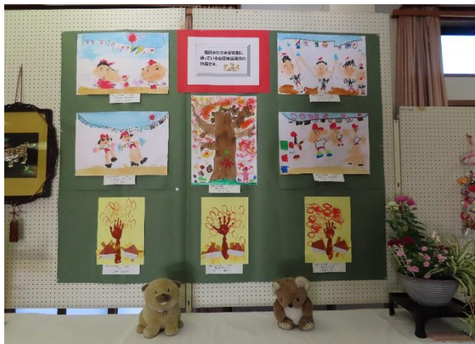
おひさま保育園へ通う安居地区の園児の作品