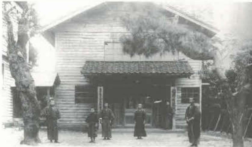
明治初期の福野町役場

あなたの思い出の写真を未来に残しませんか？ お寄せいただいた写真はデジタル化し、南砺市の貴重な文化資料として公開・保存します。